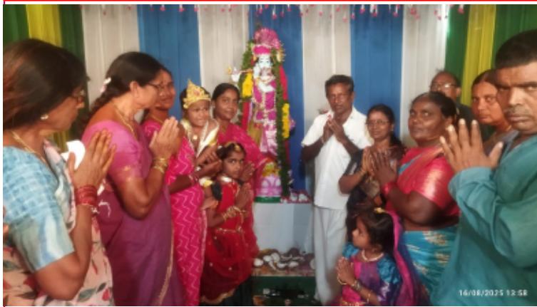
తిరుమలాయపాలెం ఆగస్టు 16 ప్రజా వేదిక ప్రతినిధి