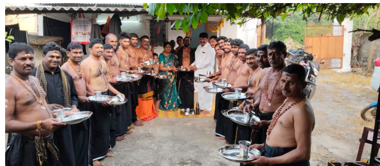
అనంతగిరి అక్టోబర్ 12 ప్రజావేదిక ప్రతినిధి