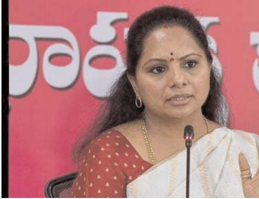
ఫీజు రీయంబర్స్మెంట్ బకాయిలు చెల్లించాలని కోరుతున్న ప్రైవేటు కళాశాలల యాజమాన్యాలను "తాట తీస్తూ, తొక్కుతూ" అంటూ సీఎం హెచ్చరించడాన్ని ఆమె తప్పుబట్టారు. సీఎం వాదిన భాష వీధి రోడ్డిలు కూడా సిగ్గుపడేలా ఉందని ఘాటగా

ముఖ్యమంత్రి రేవంత్ రెడ్డిపై తెలంగాణ జాగృతి అధ్యక్షురాలు, ఎమ్మెల్యే కల్వకుంట్ల కవిత తీవ్రస్థాయిలో విమర్శించారు. రేవంత్ భాష వీధి రోడ్డిలు కూడా సిగ్గుపడేలా ఉందని ఘాటగా