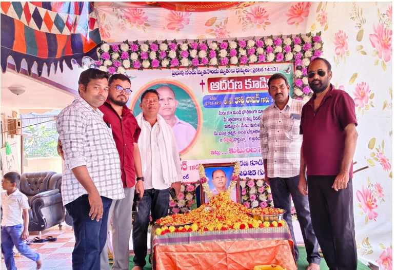
మహాత్మాగాంధీ, అంబేద్కర్ ల ఆశయాలు నెరవేరుతాయని తెలిపారు.