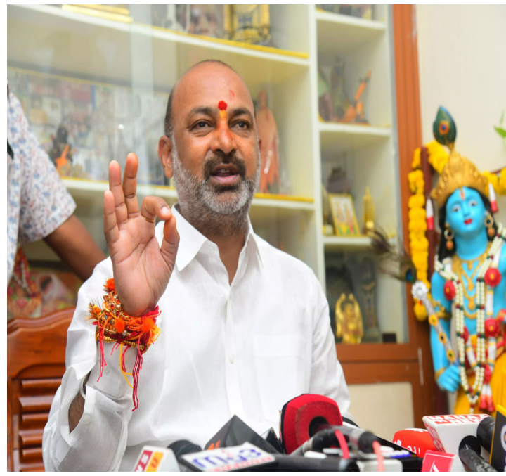
పందేమాతరం గీతం 150వ వార్షికోత్సవం సందర్భంగా రిపబ్లిక్ డే పరేడ్? ప్రత్యేక ప్రదర్శన సంగీతం అందిస్తున్న ఎం.ఎం. కీరవాణి దేశవ్యాప్తంగా 2500 మంది కళాకారులతో ఖాకీ కార్యక్రమం కీరవాణి కృషిని కొనియాడిన కేంద్ర మంత్రి బండి సంజయ్ కేంద్ర సాంస్కృతిక శాఖ ఆధ్వర్యంలో ఈ వేడుక నిర్వహణ

ప్రముఖ సంగీత దర్శకుడు, ఆస్కార్ విజేత ఎం.ఎం. కీరవాణికి కేంద్ర సహాయ మంత్రి బండి సంజయ్ అభినందనలు తెలిపారు. గణతంత్ర దినోత్సవ పరేడ్? కోసం కీరవాణి స్వరాలు సమకూర్చడం ఒక చరిత్రాత్మక ఘట్టమని ఆయన అభివర్ణించారు. పందేమాతరం గీతం 150వ వార్షికోత్సవాన్ని పురస్కరించుకుని 2,500 మంది కళాకారులతో ఈ ప్రదర్శన ఏర్పాటు చేస్తుండడం నిజంగా అద్భుతమని బండి సంజయ్ కొనియాడారు. సంగీతం, జాతీయ స్ఫూర్తి, ప్రతిష్ట అన్నీ కలగలిపిన ఈ కార్యక్రమం దేశానికి ఒక చారిత్రక నివాళి అవుతుందని ఆయన పేర్కొన్నారు.ఈనెల 26న జరిగే రిపబ్లిక్ డే పరేడ్?లో భాగంగా, కేంద్ర సాంస్కృతిక శాఖ ఆధ్వర్యంలో ఒక ప్రత్యేక ప్రదర్శన జరగనుంది. భారత స్వాతంత్ర్య స్ఫూర్తిని రగిల్చిన ‘పందేమాతరం’ గీతం 150వ వార్షికోత్సవం సందర్భంగా ఈ కార్యక్రమాన్ని నిర్వహిస్తున్నారు. దేశవ్యాప్తంగా ఎంపిక చేసిన 2,500 మంది కళాకారులు ఈ ప్రదర్శనలో పాల్గొనుండగా, దీనికి కీరవాణి సంగీతాన్ని సమకూర్చారు.