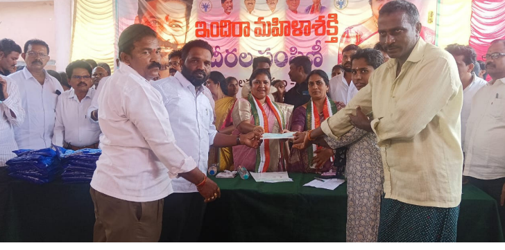
కల్లూరు జనవరి 19 ప్రజా వేదిక స్యూస్ ప్రతినిధి