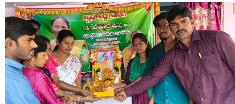
చింతకాని జనవరి 19 ప్రజా వేదిక న్యూస్