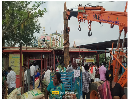
కల్లూరు మార్చి 25 ప్రజా వేదిక న్యూస్ ప్రతినిధి