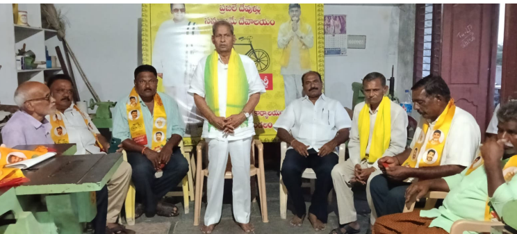
బోసకల్ మార్చి 25 ప్రజావేదిక ప్రతినిధి: