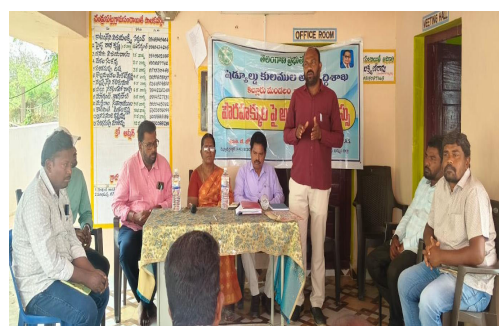
భాగంగా మారుతున్న సమాజం దృష్ట్యా ప్రజలకు పౌర హక్కులపై అవగాహన కలిగి కులం మాత్ర ప్రాధమికంగా పెద్దయ్యల కులాలు ఎన్ని ఎస్టీ బీసీ లతో అందరూ సమానమనే భావంతో ముందుకు వెళ్లాలని సూచించారు. ఎంపీడీవో మాట్లాడుతూ బావ స్వతంత్ర హక్కు స్వేచ్ఛ హక్కు బలవంతునికి బలహీనునికి ఒకే హక్కు ఉంటుందని అన్నారు.