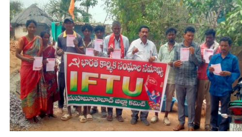
29 కార్మిక చట్టాలను 4 లేబర్ కోడ్ లుగా సవరణ చేసిందని, ఈ నాలుగు లేబర్ కోడ్ ల వలన యూవత్ భారత దేశ వ్యాప్తంగా ఉన్న కార్మిక పరానికి తీవ్రమైన నష్టం జరుగుతుందని అన్నారు. పూర్తిగా కార్పొరేట్ శక్తులకు, బడావ్యాపారస్తులకు అనుకూలంగా కార్మిక