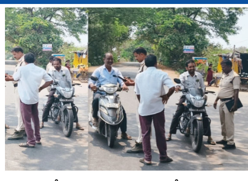
భద్రత అనేది ఒకరి బాధ్యత మాత్రమే కాదని, ప్రతి పౌరుడి బాధ్యత అన్నారు. ట్రాఫిక్ సిగ్నల్స్ పాటించడం, వేగ పరిమితులకు లోబడి డ్రైవింగ్ చేయడం, హెల్మెట్, సీట్ బెల్ట్ ధరించడం, మధ్యం