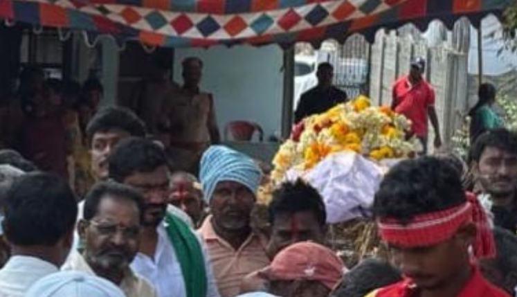
బయ్యారం, ప్రజా వేదిక న్యూస్, ఏప్రిల్ 6.