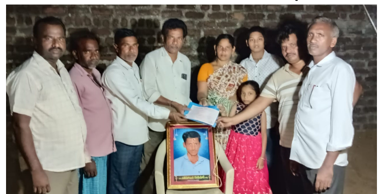
తిరుపతూపాచెం ఏప్రిల్ 13 ( ప్రజా వేదిక ) స్కూల్ ప్రతినిధి