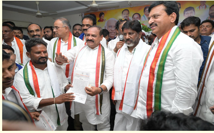
ఖమ్మం ఏప్రిల్ 14 ప్రజావేదిక న్యూస్ :