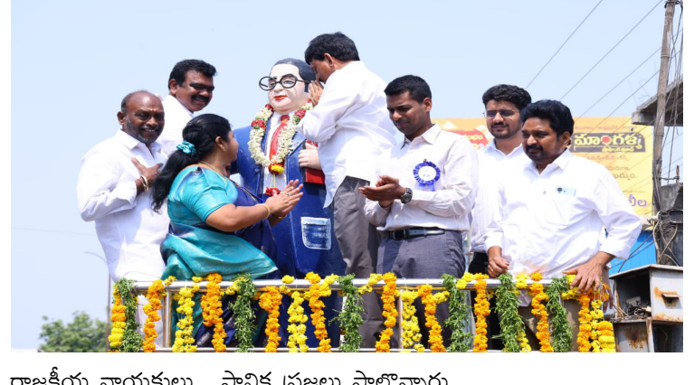
రాజకీయ నాయకులు, స్థానిక ప్రజలు పాల్గొన్నారు.