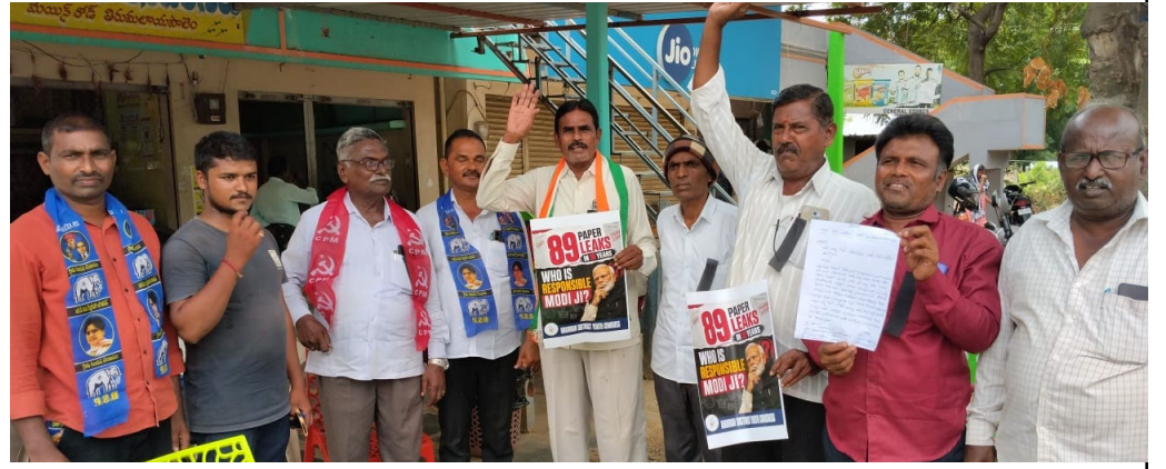
తిరుపతూరుపాలెం మే 14