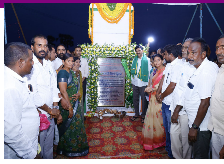
పరిస్థితి క్లిష్టంగా ఉన్నా.. ఇందిరమ్మ ఇళ్లు, ఉచిత బస్సు, రూ. 2 లక్షల రుణమాఫీ, సన్నబియ్యం బోనస్ వంటి సంక్షేమ పథకాలను నిరంతరం కొనసాగిస్తామని స్పష్టం చేశారు.