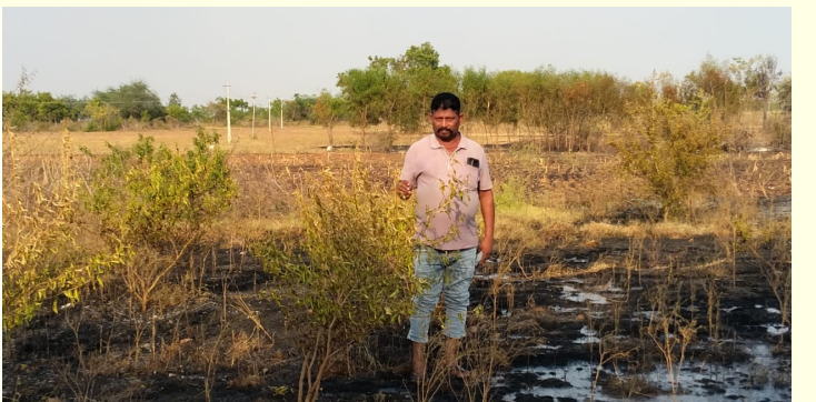
తిరుమలాయపాలెం మే 31 ( ప్రజా వేదిక ) న్యూస్ ప్రతినిధి