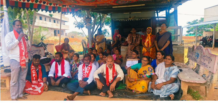
-వివో ఏ ల 11వ రోజు రిలే డిక్షన్

సీపీఐ(ఎంఎల్) న్యూడెమోక్రసీ సంఘర్షణ మద్దతు