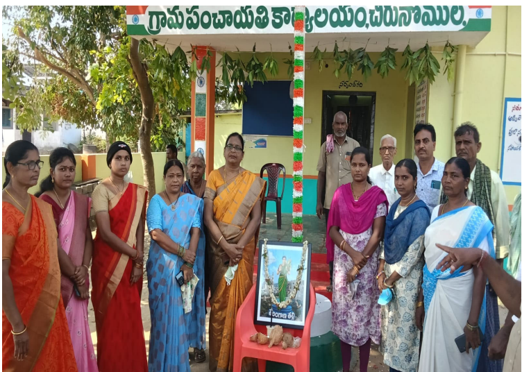
బోనకల్, జూన్ 02 ప్రజావేదిక ప్రతినిధి

తెలంగాణ రాష్ట్ర ఆవిర్భావ దినోత్సవ వేడుకలు ఘనంగా నిర్వహించారు. బోనకల్ మండల చిరునోముల, చొప్పుకట్టపాలెం, ముష్టికుంట్ల, రావినూతల ఆళ్లపాడు, బోనకల్లు, చిన్నబీరెల్లి, పెద్దబీరెల్లి, అన్ని గ్రామాలలో తెలంగాణ రాష్ట్ర ఆవిర్భావ సందర్భంగా గ్రామ సర్పంచులు జాతీయ పతాకాన్ని ఆవిష్కరించారు. ప్రజలకు తెలంగాణ రాష్ట్ర ఆవిర్భావ దినోత్సవ శుభాకాంక్షలు తెలిపారు. తెలంగాణ రాష్ట్ర సాధన కోసం పోరాడి ప్రాణత్యాగాలు చేసిన అమరవీరుల సేవలను ఈ సందర్భంగా స్మరించుకున్నారు. అనంతరం సర్పంచ్ మాట్లాడుతూ తెలంగాణ రాష్ట్రం ఏర్పడిన తరువాత అన్ని రంగాల్లో గణనీయమైన అభివృద్ధి సాధించిందని పేర్కొన్నారు. గ్రామీణాభివృద్ధి, సంక్షేమ పథకాల అమలులో తెలంగాణ దేశానికే ఆదర్శంగా నిలిచిందన్నారు. ప్రజల సహకారంతో గ్రామాన్ని మరింత అభివృద్ధి పథంలో నడిపించేందుకు గ్రామపంచాయతీ కృషి చేస్తుందని తెలిపారు. ఈ కార్యక్రమంలో గ్రామపంచాయతీ కార్యదర్శులు, గ్రామ పెద్దలు, మాజీ సర్పంచులు వార్డ్ నెంబర్లు గ్రామ ప్రజలు తదితరులు పాల్గొన్నారు.