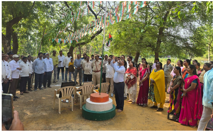
బోనకల్ జూన్ 02 ప్రజావేదిక ప్రతినిధి

తెలంగాణ రాష్ట్ర ఆవిర్భావ దినోత్సవాన్ని పురస్కరించుకొని బోనకల్ మండలంలోని అన్ని ప్రభుత్వ కార్యాలయాల్లో మంగళవారం, వివిధ శాఖల అధికారులు జాతీయ పతాకంతో ఆవిష్కరించి రాష్ట్ర సాధనలో అమరుల త్యాగాలను, స్మరించుకున్నారు. తెలంగాణ ఏర్పాటుతో సాధించిన అభివృద్ధి, ప్రజలకు అందుతున్న సంక్షేమ పథకాల, గురించి, వివరించారు. తహసీల్దార్ కార్యాలయంలో తహసీల్దార్ జాతీయ పతాకాన్ని ఆవిష్కరించి ఉద్యోగులకు రాష్ట్ర ఆవిర్భావ దినోత్సవ శుభాకాంక్షలు తెలిపారు.