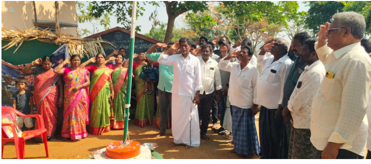
కల్లూరు, జూన్ 02 : ప్రజా వేదిక స్టూన్ ప్రతినిధి