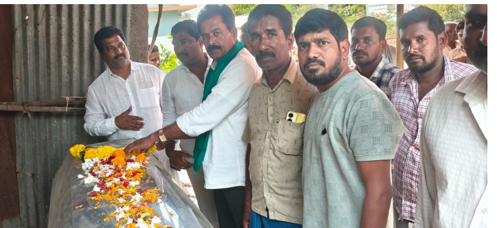
నేలకొండపల్లి జూన్ 3 ప్రజావేదిక న్యూస్