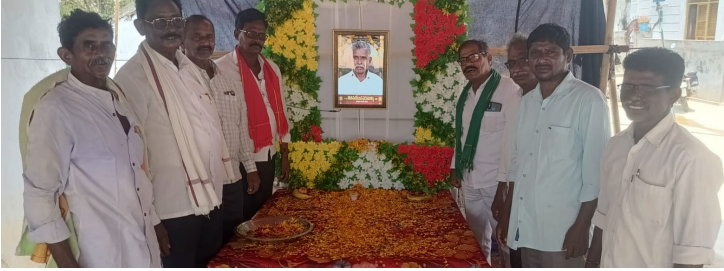
నేలకొండపల్లి జూన్ 3 ప్రజావేదిక న్యూస్