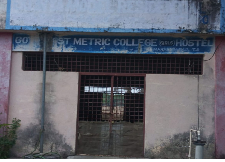
బయ్యారం, ప్రజా వేదిక న్యూస్, జూన్ 3.

బయ్యారం ప్రభుత్వ జూనియర్ కాలేజీలో చేరే అమ్మాయిలకు ఉచిత హాస్టల్ సౌకర్యం కలిపిస్తున్నట్లు హాస్టల్ వార్డెన్ తెలిపారు. జూనియర్ కళాశాలలో అడ్మిషన్ కొరకు కళాశాల ప్రిన్సిపాల్ ని సంప్రదించాలన్నారు. మండలంలో ఎస్సీ, ఎస్టీ, బీసీ, బాలికల కోసం ప్రభుత్వం ఉచిత హాస్టల్ వసతిని కల్పిస్తుంది. పోస్ట్ మేట్రిక్ హాస్టల్ నందు అడ్మిషన్ పొందాలంటే ప్రభుత్వ మార్గదర్శకాల ఆధారంగా దరఖాస్తు చేసుకోవాలన్నారు. అడ్మిషన్ ప్రక్రియ వివరాలు: అర్హత ప్రమాణాలు విద్యార్హత ఇంటర్మీడియట్, డిగ్రీ చదువుతున్న విద్యార్థినిలకు పోస్ట్ మేట్రిక్ హాస్టల్లో సీట్లు అందుబాటులో ఉన్నాయి. ఆదాయ పరిమితి: కుటుంబ వార్షిక ఆదాయం ప్రభుత్వం నిర్దేశించిన పరిమితి ఉండాలి. రిజిస్ట్రేషన్: ఎస్సీ, ఎస్టీ, బీసీ, విద్యార్థినిలకు నిర్దిష్టమైన సీట్లు కేటాయింబడతాయన్నారు. కావల్సిన పత్రాలు - కుల ధృవీకరణ పత్రం, ఆదాయ ధృవీకరణ పత్రం, పదో తరగతి మార్కుల మెమో, స్టడీ సర్టిఫికేట్, ఆధార్ కార్డు, రేషన్ కార్డు, రెండు పాస్ పోర్ట్ సైజ్ ఫోటోలు తీసుకొని జూనియర్ కళాశాల ఎదురుగా ఉన్న పోస్ట్ మాట్రిక్ హాస్టల్ ను సంప్రదించాలన్నారు.