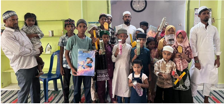
బయ్యారం, ప్రజా ప్రతిభ, జూన్ 3.

కొత్తపేట మసీదులో అరబిక్ తాలీమ్ అనే కార్యక్రమాన్ని నిర్వహించారు. ఈ సందర్భంగా ఇస్లామిక్ విద్యా తరగతులను, ఖురాన్ పఠనాన్ని మతపరమైన బోధనలను బోధించారు. కొత్తపేట మజిద్ నందు నిర్వహించిన అరబి తాలీమ్ విశ్వాస కార్యక్రమంలో సెలవులలో పిల్లలకు మంచి విధానాలతో అరబీ తాలీమ్ మంచి విధంగా నేర్చుకున్నారన్నారు. ఈ కార్యక్రమం ముగింపు సందర్భంగా పిల్లలందరికీ బహుమతులతో సత్కరించారు.