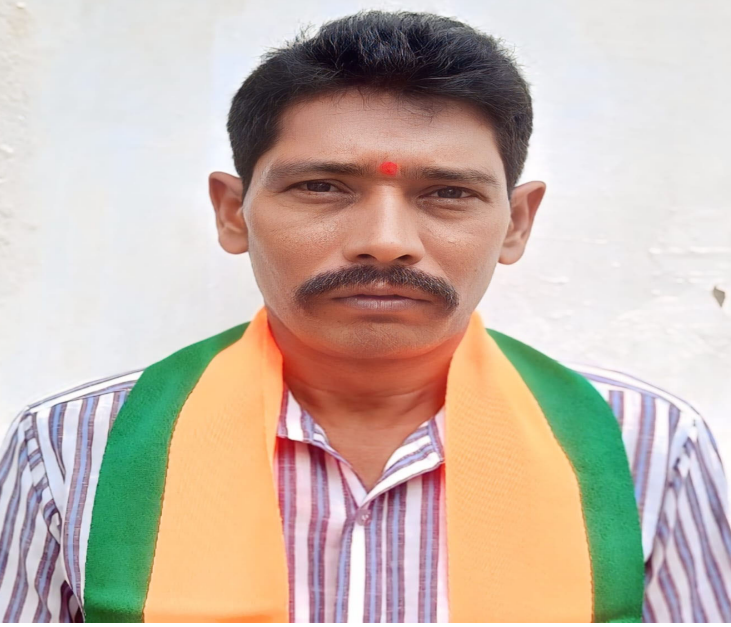
బయ్యారం,ప్రజా వేదిక స్పాన్సర్,జూన్ 7.

దేశంలో త్వరలో 'ఆర్థిక సునామీ' రాబోతోందని, ప్రభుత్వం ఎమర్జెన్సీ తరహా పరిస్థితులను ప్రకటించవచ్చని కాంగ్రెస్ అగ్రనేత రాహుల్ గాంధీ చేసిన వ్యాఖ్యలను బీజేపీ మండల ప్రధాన కార్యదర్శి తుమ్మల శ్రీనివాస్ రావు తీవ్రంగా ఖండించారు. ఇవి కేవలం ప్రజల్లో భయాన్ని సృష్టించే ప్రయత్నాలని, భారత ఆర్థిక వ్యవస్థ ప్రపంచ సవాళ్లను తట్టుకుని పటిష్టంగా ఉందని స్పష్టం చేశారు. గతంలో దేశాన్ని ఆర్థిక ఒత్తిళ్ల నుంచి కాంగ్రెస్ పార్టీ కాపాడిన వ్యవస్థలను బీజేపీ ప్రభుత్వం నిర్వీర్యం చేసిందని రాహుల్ ఆరోపించారు. రాహుల్ వ్యాఖ్యలు తప్పు మాత్రమే కాదు, ఇది కచ్చితంగా ప్రజల్లో భయాన్ని వ్యాప్తి చేయడమేనని తుమ్మల శ్రీనివాస్ విమర్శించారు. గత దశాబ్ద కాలంలో ఆర్థిక, రక్షణ వ్యవస్థలను బీజేపీ బలోపేతం చేసిందని గుర్తు చేశారు. పెరుగుతున్న విద్యుత్ వినియోగం, వాహన అమ్మకాలు, ప్రవృత్త్యాణం అదుపులో ఉండటం, భారీ విదేశీ మారక నిల్వలు వంటివి దేశ ఆర్థిక పటిష్టతకు నిదర్శనమని శ్రీనివాస్ పేర్కొన్నారు. సునామీ 2013లో వచ్చిందని ఇప్పుడు కాదని వ్యంగ్యంగా అన్నారు. కాంగ్రెస్ ఈ దేశంలో వినాశనాన్ని సృష్టిస్తే, బీజేపీ దృఢంగా ముందుకు సాగుతోందని అన్నారు. రాహుల్ గాంధీకి ఆయన నాయనమ్మ ఇందిరా గాంధీ విధించిన 1975 ఎమర్జెన్సీని గుర్తుచేసి అన్నారు. ప్రధాని నరేంద్ర మోదీ ప్రజాస్వామ్యానికి కట్టుబడి ఉన్నారని వారు తెలిపారు. రాహుల్ పదేపదే ఇలాంటి హెచ్చరికలు చేస్తూ దేశంలో ఆస్తిరత సృష్టించాలని చూస్తున్నారని తుమ్మల శ్రీనివాస్ తీవ్రంగా విమర్శించారు.