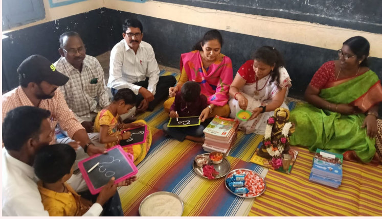
బయ్యారం, ప్రజా వేదిక న్యూస్, జూన్ 17.