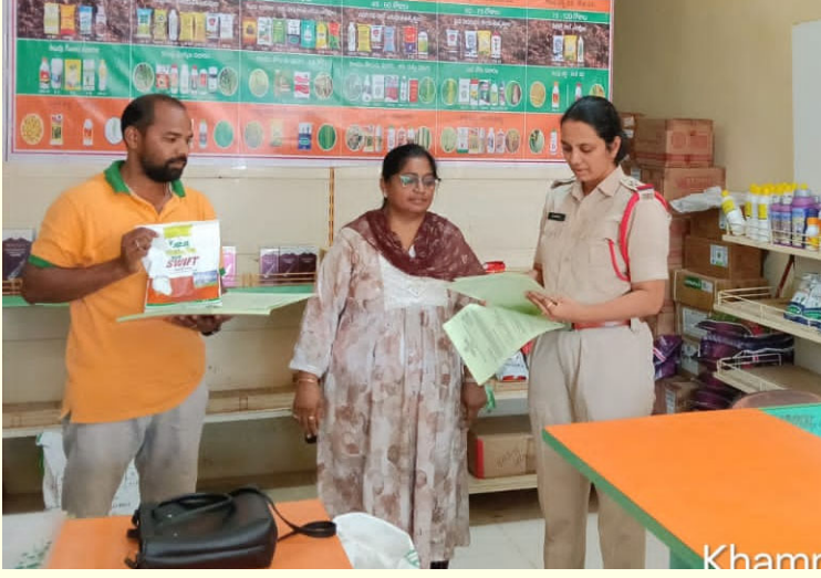
కల్లూరు జూన్ 19 ప్రజా వేదిక సూన్స్

నకిలీ విత్తనాలు అరికట్టెం దుకు పోలీసు, వ్యవసాయ శాఖ అధికారులు ఉమ్మడిగా కల్లూరు మండలంలోని విత్తన, ఎరువులు దుకాణాలలో ఎన్ని చారిత, వ్యవసాయ శాఖ ఏవో రూప ఆకస్మిక తనిఖీలు నిర్వహించారు. పోలీస్ కమిషనర్ సునీల్ దత్ ఆదేశాల మేరకు వ్యవసాయ శాఖ ఏవో ఆధ్వర్యంలో కల్లూరు లోని ఫర్టిలైజర్స్ అండ్ సీడ్స్ షాపులను సందర్శించి, విక్రయాల రికార్డులు, స్టాక్ వివరాలు, లైసెన్సులు, బిల్లుల నిర్వహణ, నిల్వల పరిస్థితులను క్షుణ్ణంగా పరిశీలించారు. రైతులకు విక్రయిస్తున్న విత్తనాలు, ఎరువులు ప్రభుత్వ నిబంధనలకు అనుగుణంగా ఉన్నాయా లేదా అనే విషయాన్ని ఆరా తీశారు. అలాగే ప్యాకెట్లపై ఉన్న వివరాలు, తయారీ తేదీలు, గడువు తేదీలు, కంపెనీ గుర్తింపు తదితర అంశాలను పరిశీలించారు. రైతులు విత్తనాలు, ఎరువులు కొనుగోలు చేసే సమయంలో తప్పనిసరిగా బిల్లు తీసుకోవాలని సూచించారు. బిల్లు లేకుండా కొనుగోలు చేసిన వస్తువుల విషయంలో భవిష్యత్తులో సమస్యలు తలెత్తితే చర్యలు తీసుకోవడం కష్టమవుతుంది దని తెలిపారు. అలాగే అనుమానాస్పదంగా కనిపించే విత్తనాలు లేదా ఎరువుల గురించి వెంటనే వ్యవసాయ శాఖ అధికారులకు సమాచారం అందించాలని కోరారు.